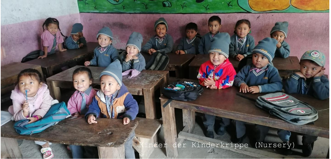
Kinder der Kinderkrippe (Nursery)