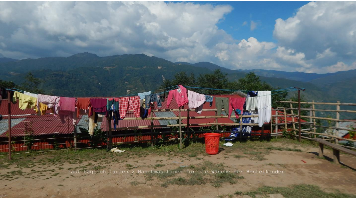
Fast täglich laufen 2 Waschmaschinen für die Wäsche der Hostelkinder